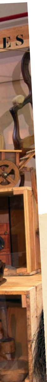
ents de la collection