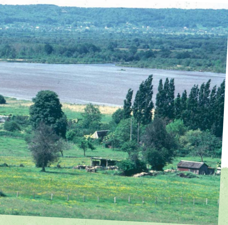
Vaste étang naturel, la Grand'Mare est l'objet d'un grand chantier de curage

des activités humaines et le respect des écosystèmes, des espèces et des zones soumises à de fortes pressions en passe d'étouffer ou à des côtés des acteurs du terrain, il encourage les initiatives de gestion avec les nécessités économiques, sociales et culturelles.