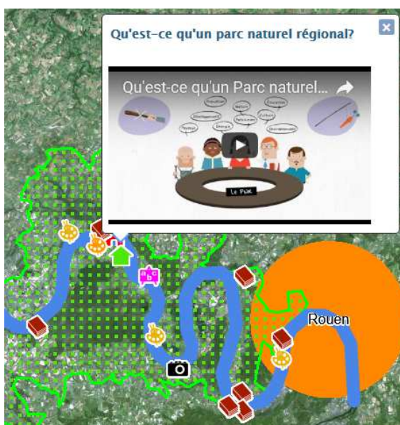
© Antoine Vaillant (Capture d'écran Edugéo)