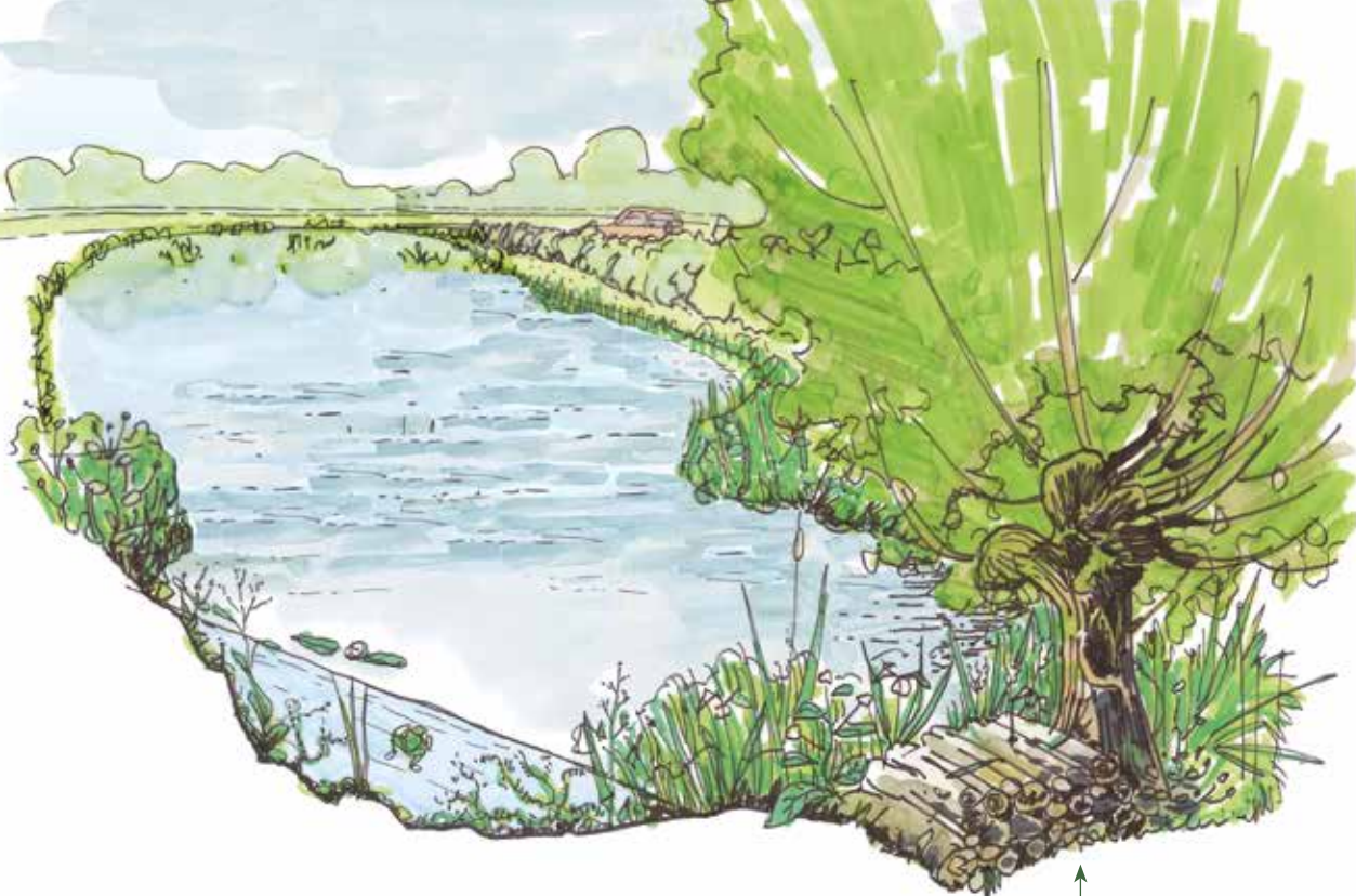
Zone de refuge

Ce document concerne uniquement les zones humides chassées terrestres des départements de l'Eure et de Seine-Maritime