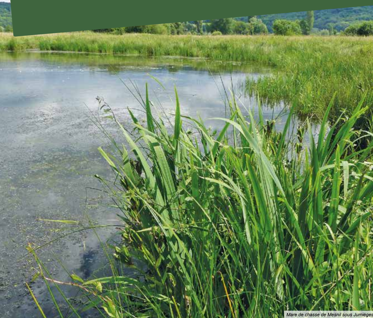
Mare de chasse de Mesnil sous Jumièges