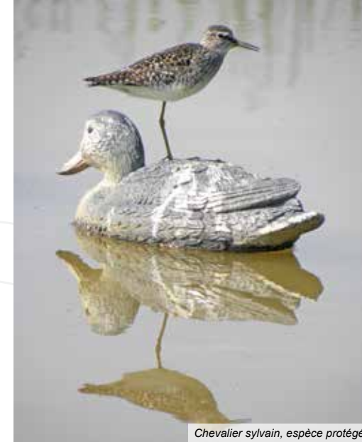
Chevalier sylvain, espèce protégée