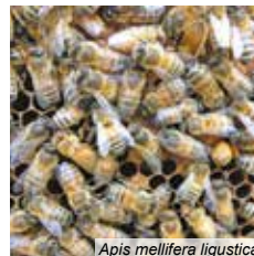
Apis mellifera ligustica