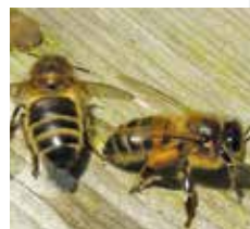
Apis mellifera mellifera

Contrairement aux autres races citées, l'abeille noire est celle dont on a le plus négligé la sélection.